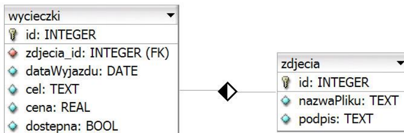
Obraz 1. Tabele wycieczki i zdjecia

Do wykonania zadania należy użyć tabel wycieczki i zdjecia przedstawione na Obrazie 1. Wycieczka jest dostępna, jeśli pole dostepna przyjmuje wartość TRUE