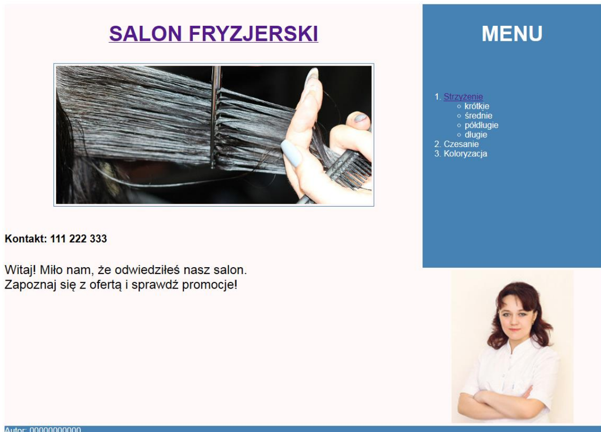
Obraz 2. Witryna internetowa, strona index.html , ramka obrazu pojawia się, gdy kursor znajduje się nad obrazem