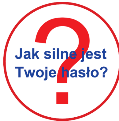
Rysunek 1. Grafika

Witryna internetowa wykorzystuje grafikę, którą należy przygotować i jest ona zgodna z rysunkiem 1.