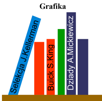
Obraz 1. Grafika wektorowa

Aby wykonać zadanie, zaloguj się na konto Egzamin bez hasła. Wyniki swojej pracy zapisz w folderze utworzonym na pulpicie konta Egzamin . Jako nazwy folderu użyj swojego numeru PESEL.