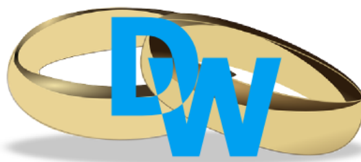
Obraz 1c. Logo Domu Weselnego

Przy pomocy programu do obróbki grafiki wektorowej wykonaj logo zgodne z przedstawionym Obrazem 1c. Kolejne kroki wykonania logo przedstawiają obrazy 1a – 1c.