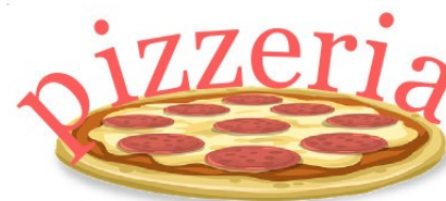
Obraz 1c. Logo pizzerii

Przy pomocy programu do obróbki grafiki wektorowej wykonaj logo zgodne z przedstawionym Obrazem 1c. Kolejne kroki wykonania logo przedstawiają obrazy 1a – 1c.