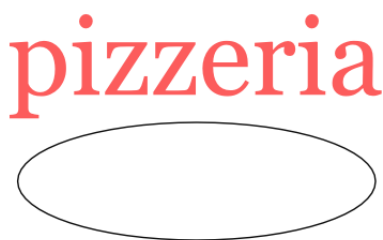
Obraz 1a. Napis i elipsa