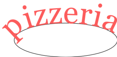
Obraz 1b. Napis dopasowany do ścieżki