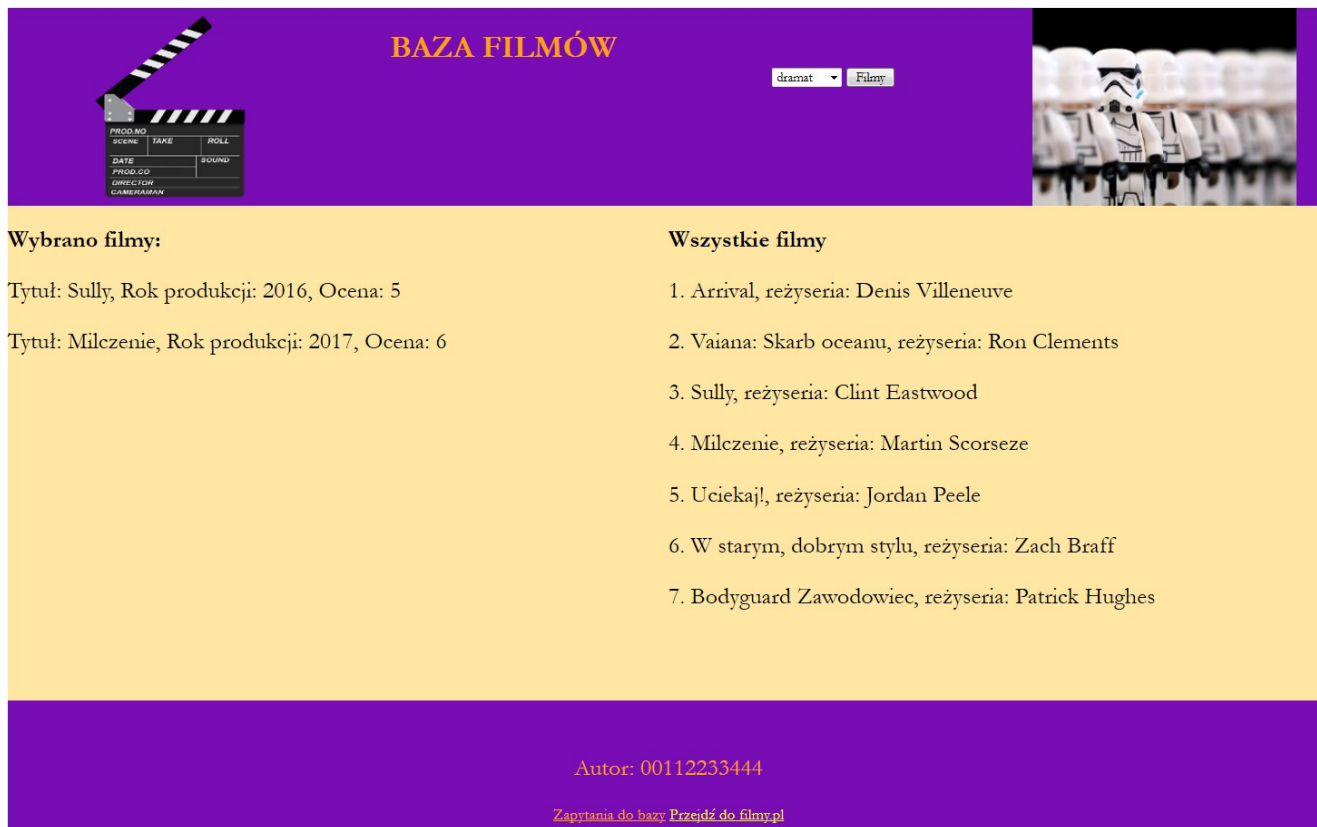
Obraz 2. Witryna internetowa z listy rozwijanej wybrano „dramat”.