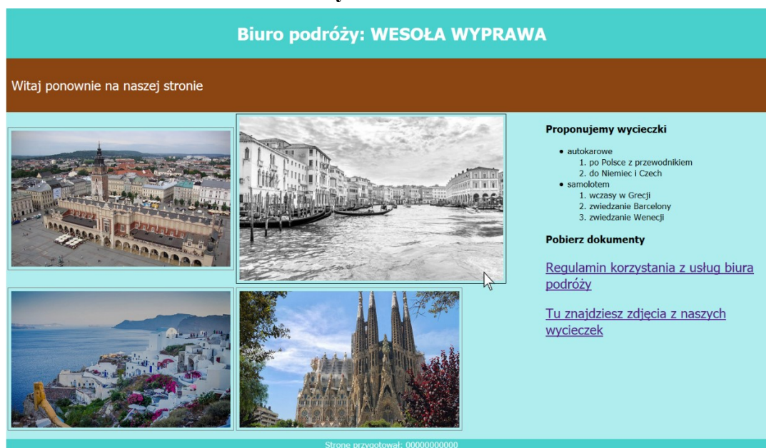
Obraz 2. Witryna internetowa, strona odwiedzana po raz kolejny, kursor na grafice wlochy.jpg