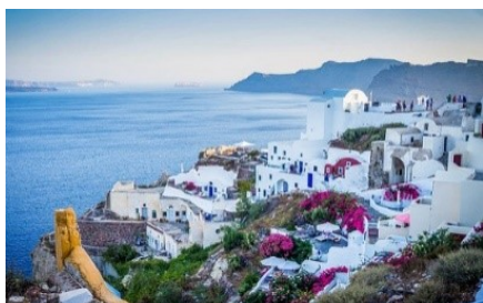
Obraz 1a. oryginalny obraz