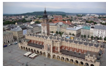
Obraz 1c. Po odcięciu dolnej części obrazu