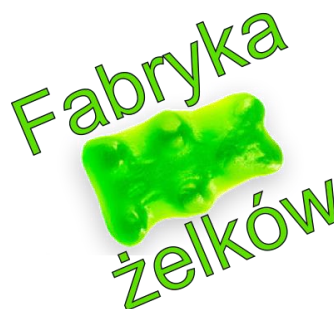
Obraz 1b. Logo