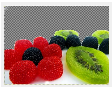
Obraz 1a. Przezroczystość zdjęcia cukierki1

Zdjęcie cukierki3.jpg należy przeskalować do rozmiaru 533 px na 400 px