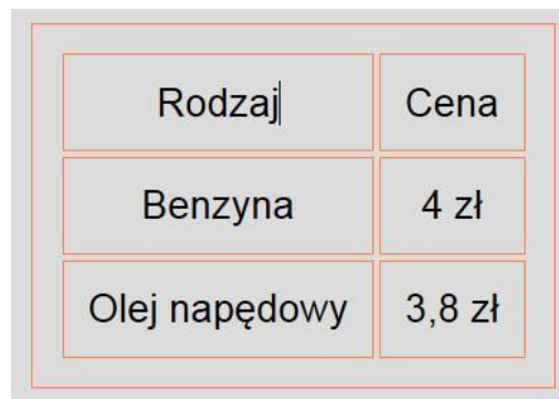
Obraz 2. Tabela z pliku index.html