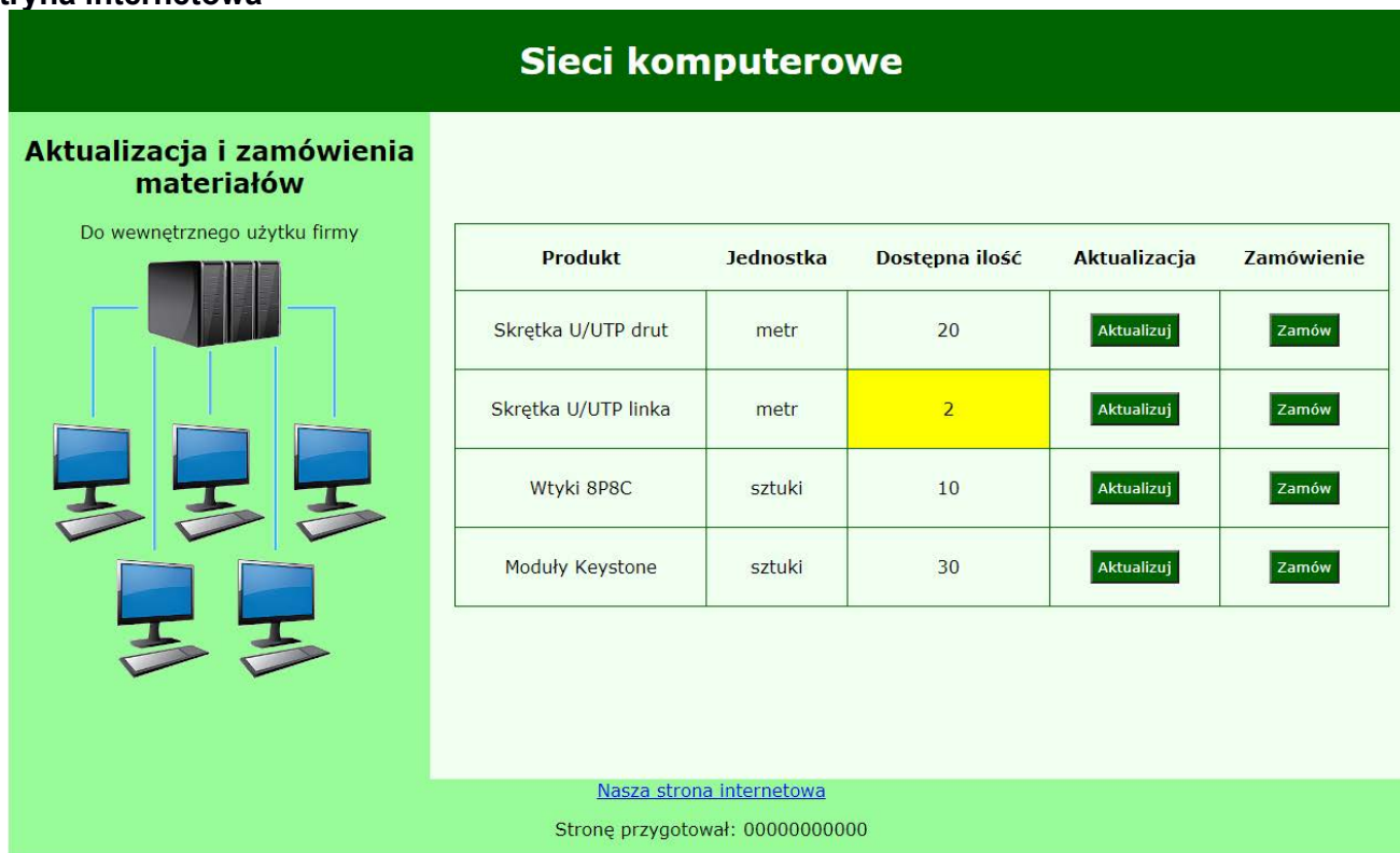
Obraz 2. Witryna internetowa. Stan początkowy